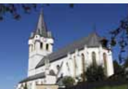
Bad St. Leonhard

Schon Paracelsus verwies auf die heilende Wirkung des Schwefelbades in der Stadt Bad St. Leonhard. Ein modernes Gesundheitszentrum, exzellente Gastronomie und ein facettenreiches Kulturleben sind besonderer Ausdruck der Lebensqualität im oberen Lavanttal.